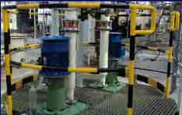
Bombas verticales sumergidas en planta de cloro-sosa.

Las bombas TECNIUM se fabrican con las últimas tecnologías de producción bajo estrictas normas de calidad, y destacan por su fiabilidad de funcionamiento y su robustez, garantizando ciclos de vida de producto muy largos y facilidad de mantenimiento.