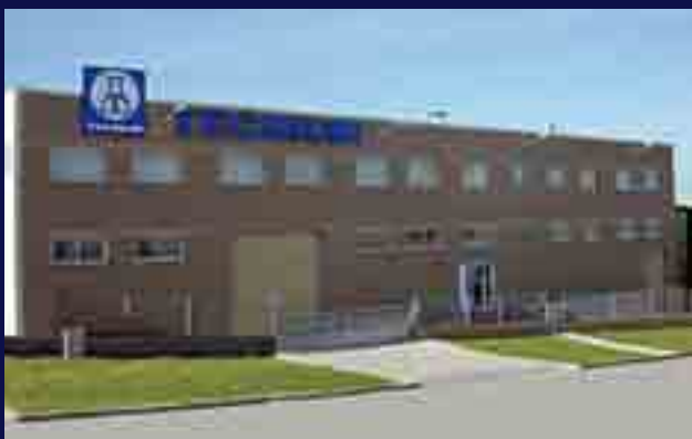
Instalaciones TECNIUM en Manresa - Barcelona.