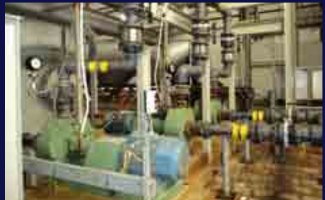
Bombas de proceso normalizadas EN-ISO 22858 en mina de uranio.