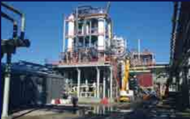
Planta completa llaves en mano de fabricación de NaOCl.

Esto nos permite colaborar con ingenierías de todo el mundo realizando proyectos destinados al cumplimiento medioambiental que incluyen el diseño, la construcción y el mantenimiento de instalaciones para una gran variedad de sectores industriales.