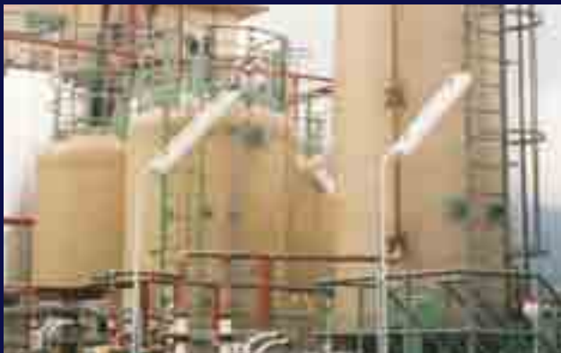
Conjunto de depósitos según APQ.

Con una gama de equipos muy extensa que incluye depósitos, reactores, cubas, cubiertas, valvulería especial en plásticos macizos y accesorios diversos, TECNIUM se ha convertido en un proveedor global que ha sido capaz de ganarse una posición de liderazgo gracias a sus múltiples referencias en todos los continentes.