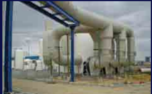
Estudio aerodinámico de red de captaciones y equipos de control de olores.