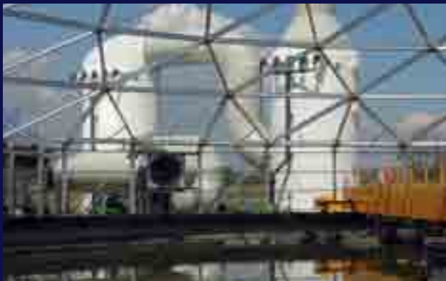
Control de olores mediante vía química en EDAR Urbana.

Cerramientos, captaciones y chimeneas: Todo control de olores empieza por confinar, captar y minimizar los focos de olores. TECNIUM dispone de los equipos necesarios para este cometido, suministrando cubiertas modulares, redes de captación y ventilación y chimeneas.