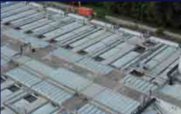
Ingeniería y suministro de cubiertas móviles para EDAR Urbana.