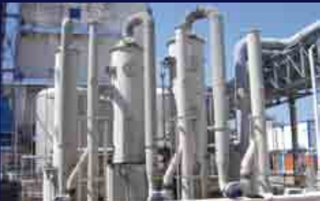
Control de emisiones en planta química mediante scrubbers químicos.