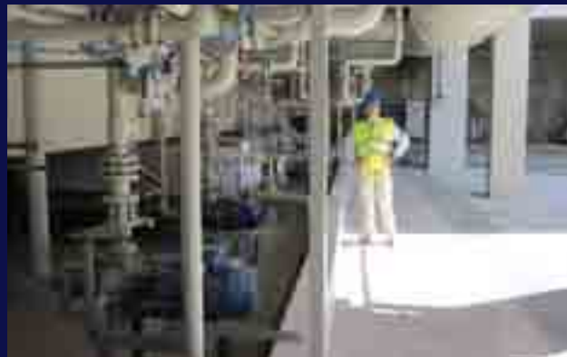
Siempre estamos ahí.