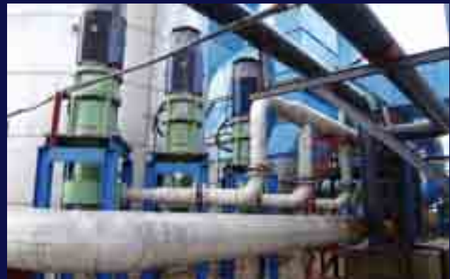
Bombas verticales para líquidos corrosivos en planta de fertilizantes.