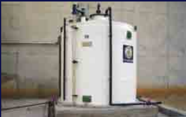
Depósito de doble pared.