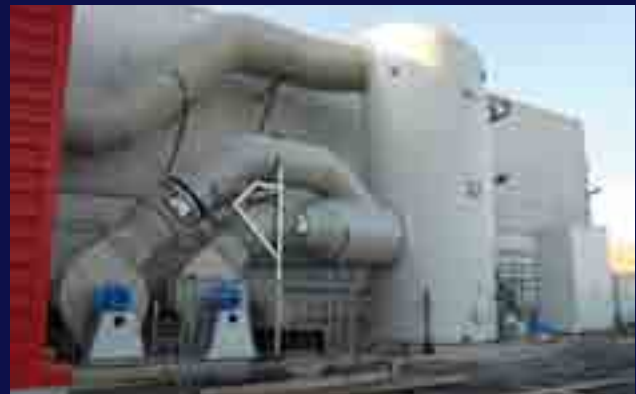
Sistema de humidificación para control de olores en planta de RSU.