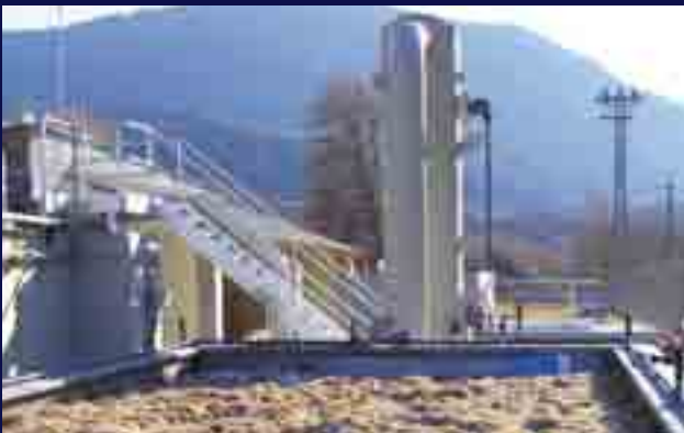
Control de olores mediante biofiltro en EDAR Urbana.