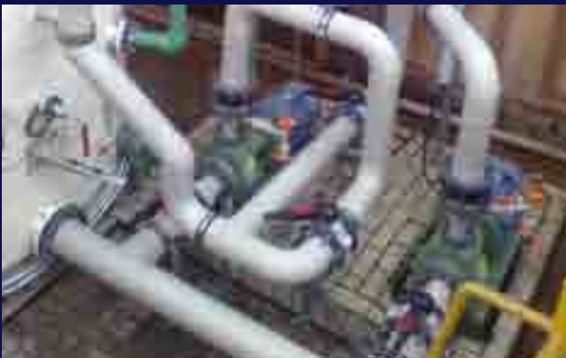
Motobombas para la transferencia de reactivos en industria química.