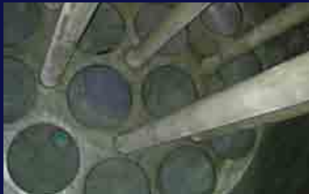
Reactor para industria química.