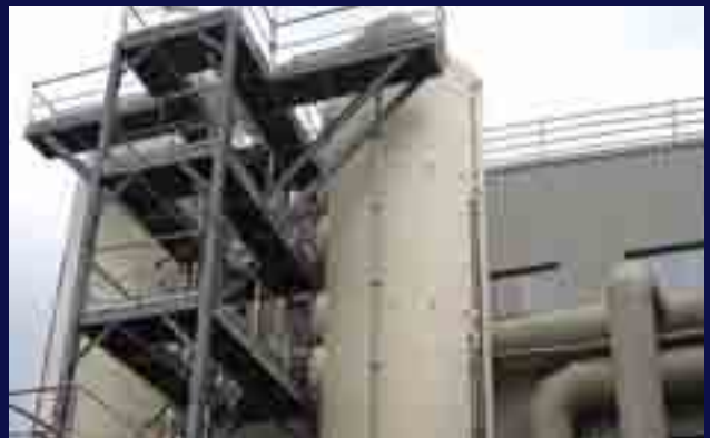
Control de emisiones mediante biotrickling en industria papelera.