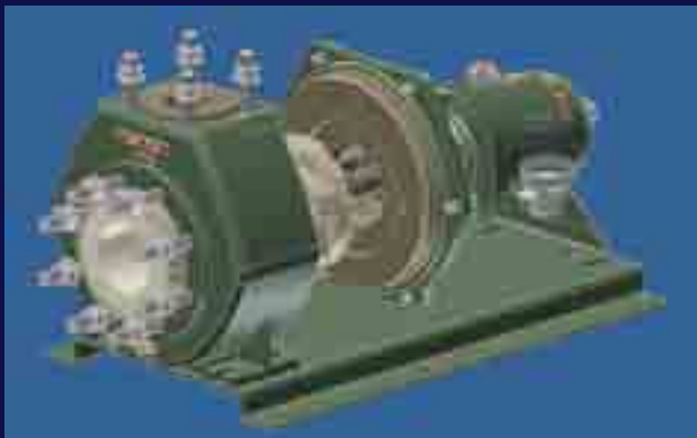
Soluciones innovadoras a problemas específicos.

POR PRESENCIA GLOBAL. Red internacional de filiales y colaboradores que permiten suministrar nuestros productos y servicios en todo el mundo.