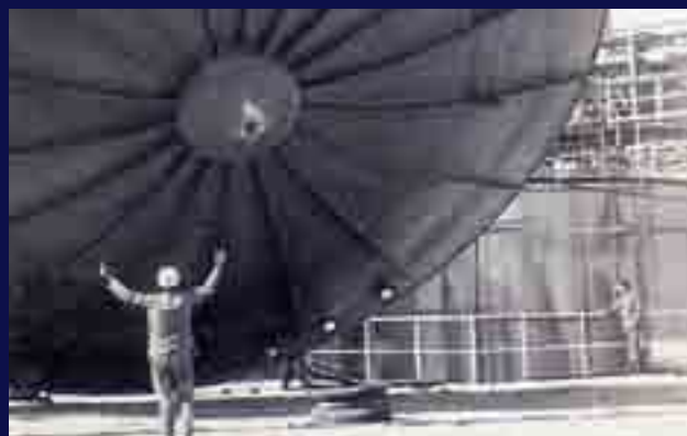
Desde 1957, una empresa pionera.