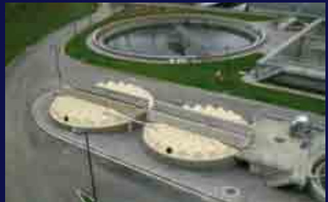
Cubiertas modulares en EDAR Urbana.