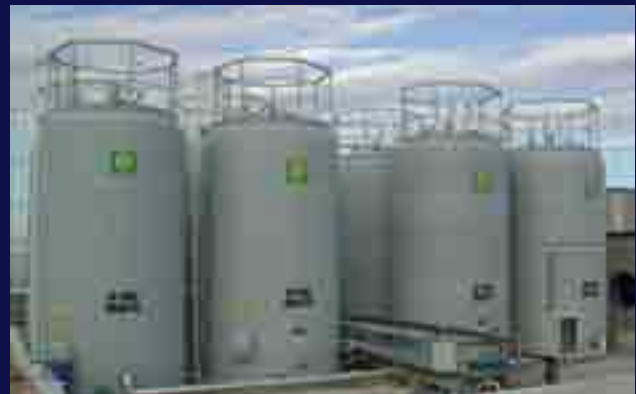
Parque de almacenamiento de líquidos corrosivos.