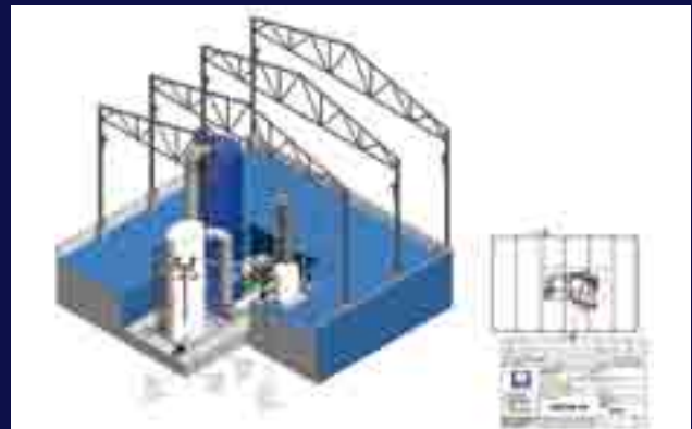
Diseños en 3D y cálculo por elementos finitos.