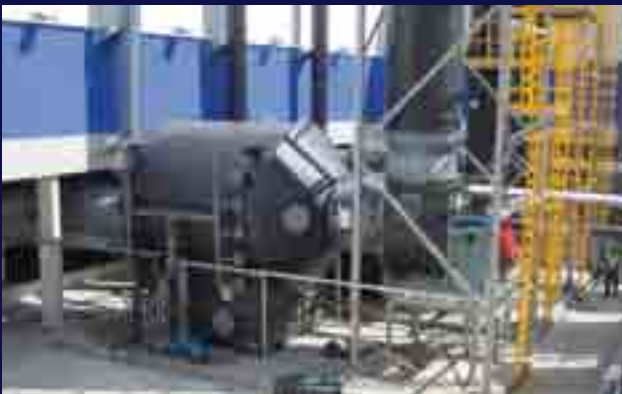
Lavado de gases procedentes de cubas de cromado de piezas utilizadas en la industria aeroespacial.

A pesar de las especificidades de cada proceso industrial, TECNIUM dispone del conocimiento y experiencia para ofrecer soluciones adecuadas a cada necesidad. Soluciones que se extienden por todo el mundo bajo el sello de calidad y eficiencia de TECNIUM.