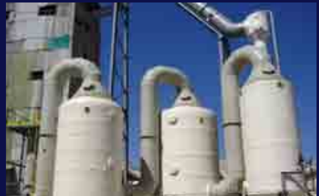
Instalación de despolvo y lavado de gases en industria de fertilizantes.